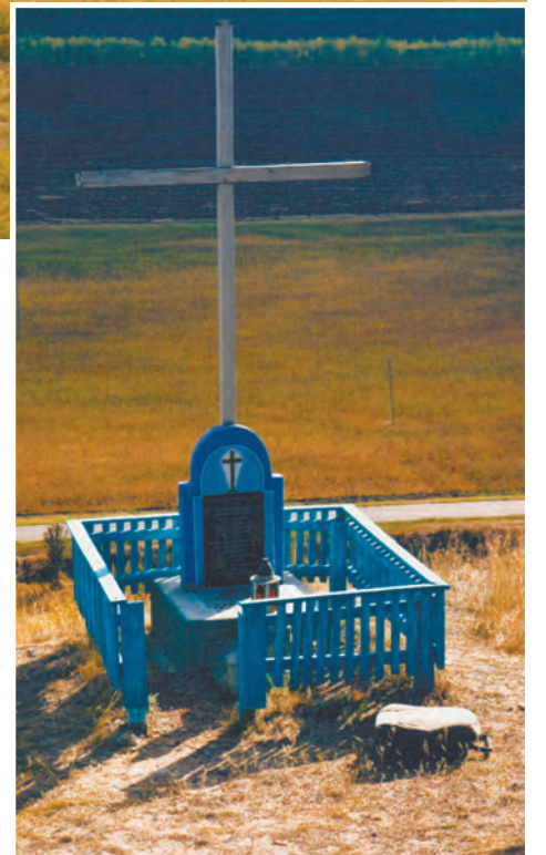
Крест на Каменной горе

дирования было много. Народ разжился маленько хозяйственными товарами, но следом шли наши трофейные команды и все «лишнее» поотбирали. Что-то разрешали оставить. Например, на семью из трех человек давали три пары армейских башмаков.