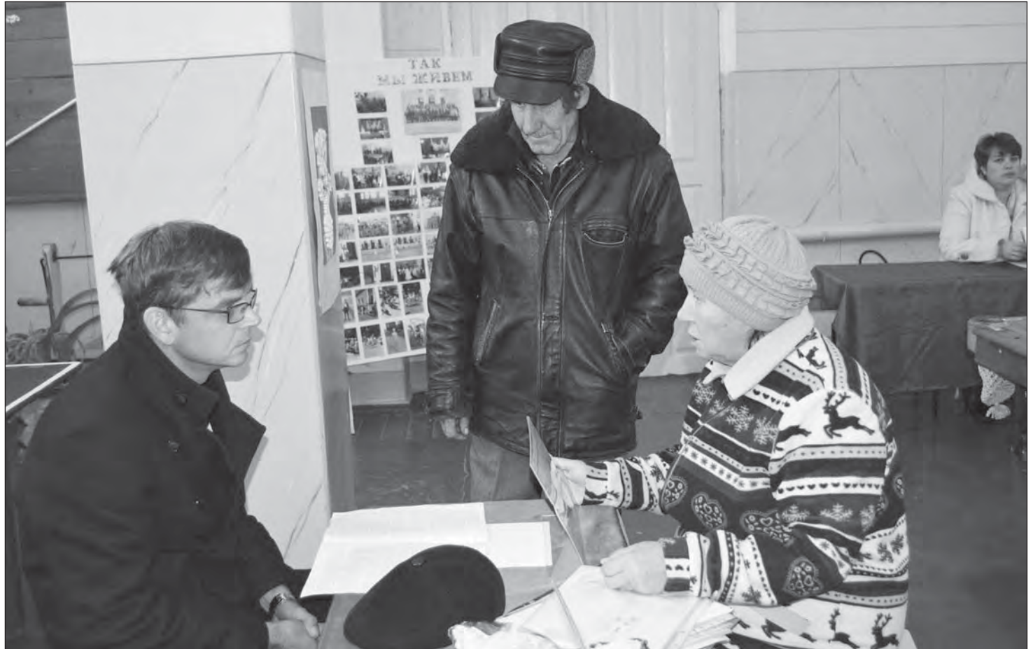
Среди вопросов, которые задавали селяне, были и те, что касались ЖКХ